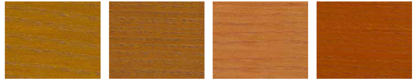
10083 EICHE ANTIK 10009 EICHE DUNKEL 0817 LAVARØD 0530 HERBSTROT