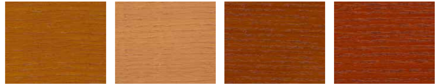
0623 TEAK 0935 SIBIRISCHE LÄRCHE 0909 KASTANIE 10045 MAHAGONI