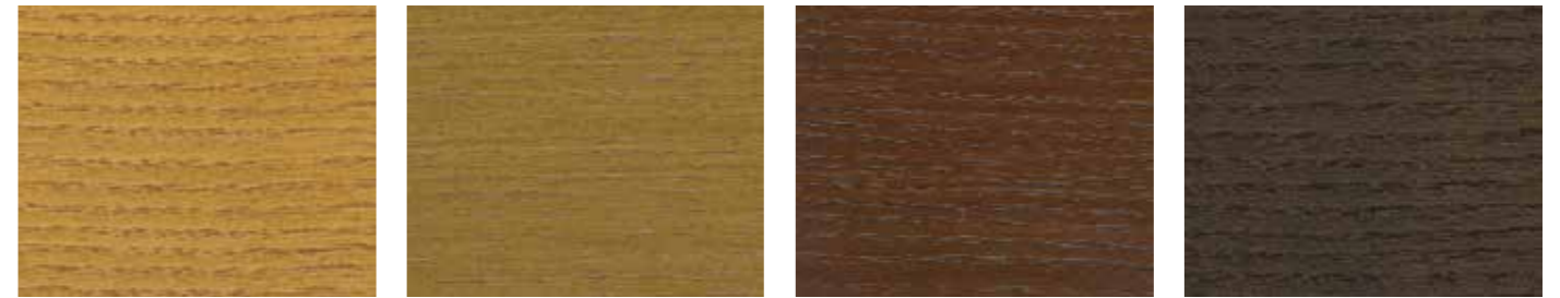
0868 EICHE HELL 0678 FURU 0676 TJÆREBRUN 0675 SETERBRUN