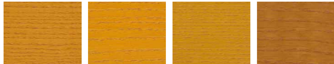
10077 KIEFER 0687 ÅKERGUL 0810 HEIGUL 10006 EICHE