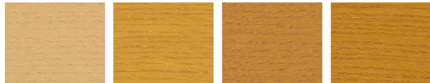
0629 LÅRIKS 0630 LØNN 10996 ESCH 10073 ALTKIEFER

JOTUN a développé une large palette de teintes traditionnelles et contemporaines. Celles-ci donneront un nouvel aspect à vos boiseries tout en renforçant leur longévité. Les teintes réelles dépendent de l'essence de bois et de l'application.