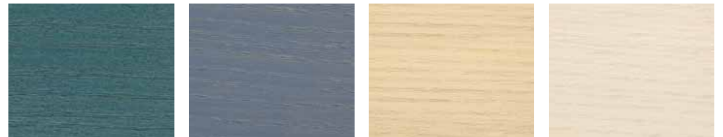
0544 BERGBLAU 0933 TAUBENBLAU 0505 SCHLEIER 0600 HVIT