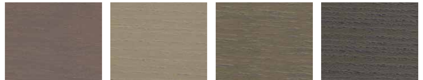
0639 FJELLGRÅ 0934 SILBERGRAU HELL 616T STAHLGRAU 0724 GRAPHITGRAU