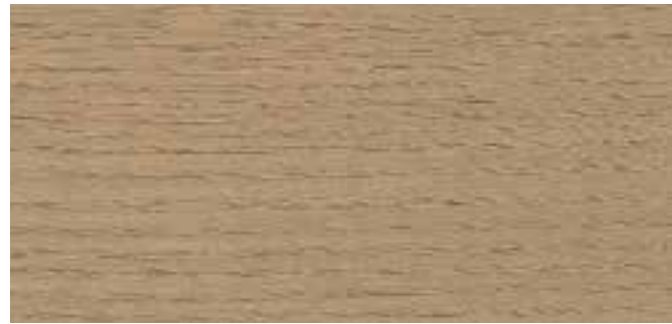
9074 NORDISK TRE