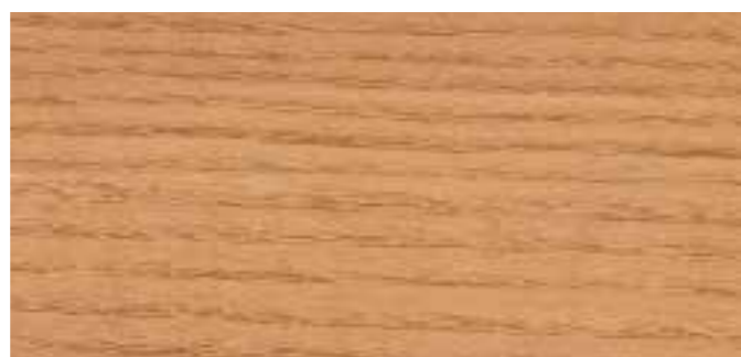
0935 SIBIRISCHE LÄRSCHE