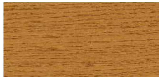
10009 EICHE DUNKEL