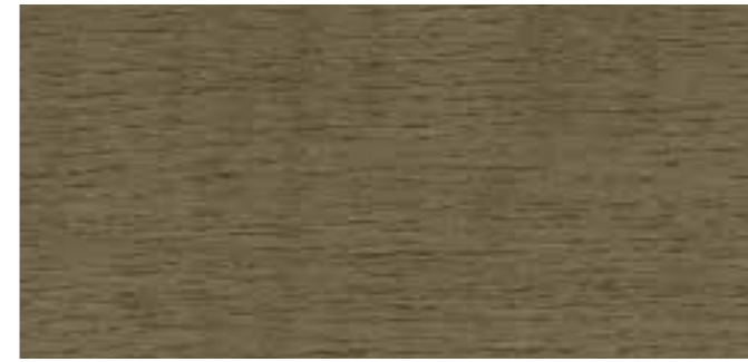
0637 NY STENGRÅ