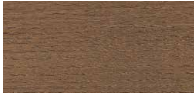
9052 EKSOTISK TRE