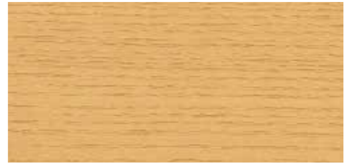
0631 NATURAL WOOD