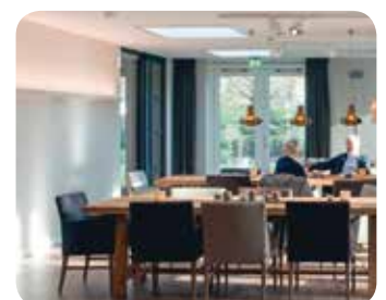
Bijdrage aan een beter binnenklimaat.