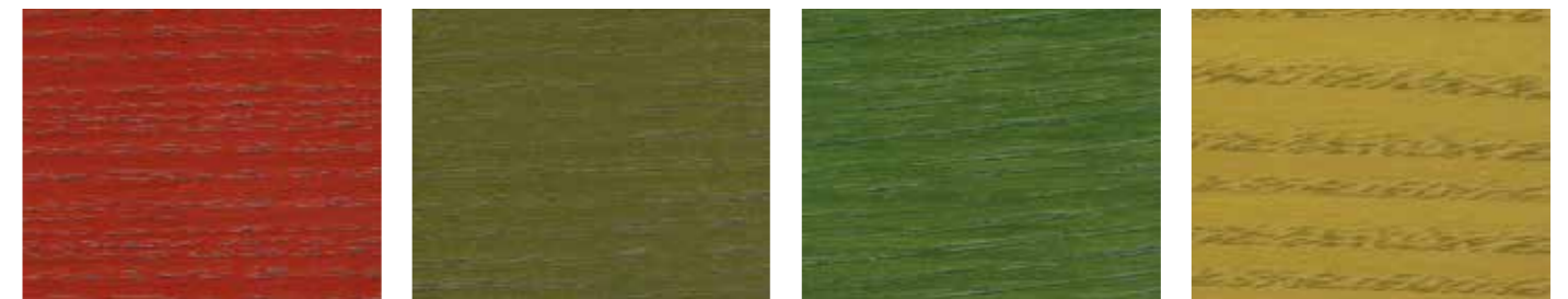
0686 KIRSEBÆR 0837 APAL 0844 MISTEL 0835 LIGRØNN